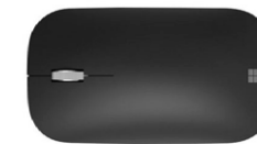
Surface Mobile Mouse 33,59 €