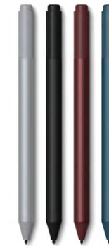
Surface Pen 89,- €